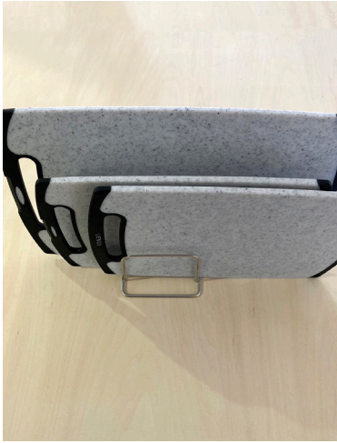
まな板(魚介類・食肉類・野菜類)