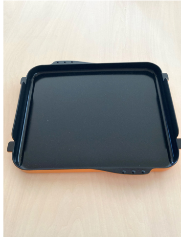
プレートパン *スマートコンロ用