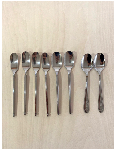
スプーン(小) × 8