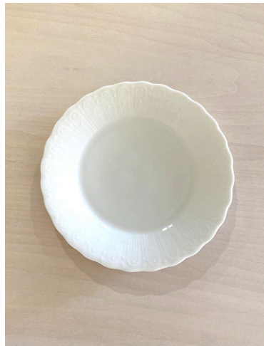
平皿(小) × 8