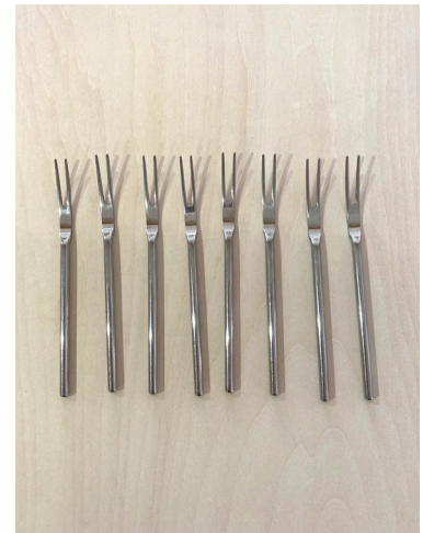
フォーク(小) × 8