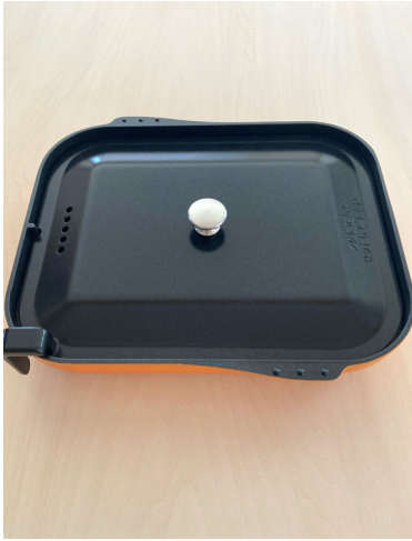
キャセロール *スマートコンロ用