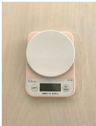
キッチンスケール