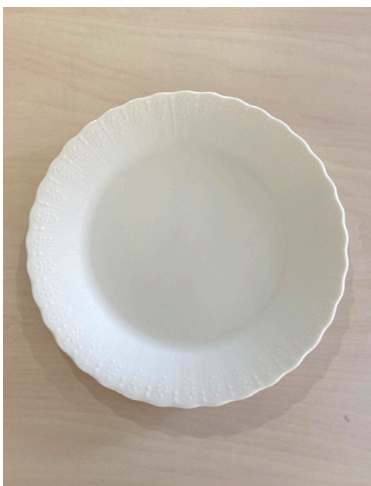
平皿(大) × 8