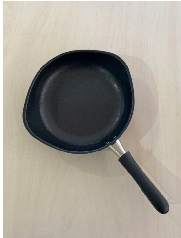
フライパン(22.5cm) *フタあり