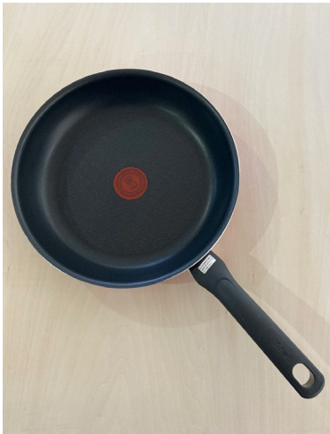
フライパン(26cm) *フタあり