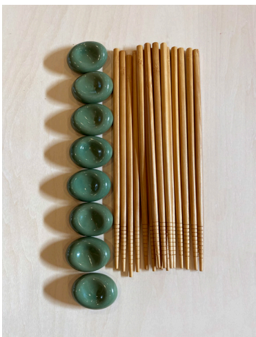
箸&箸置き × 8