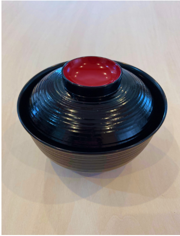
汁椀 × 5