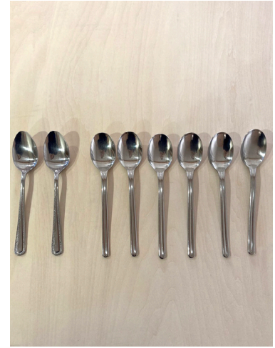
スプーン(大) × 8