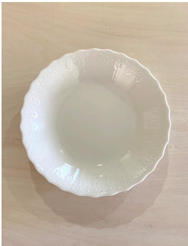
深皿 × 8