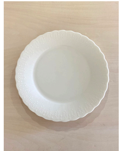
平皿(中) × 8