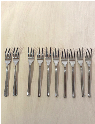
フォーク(大) × 8