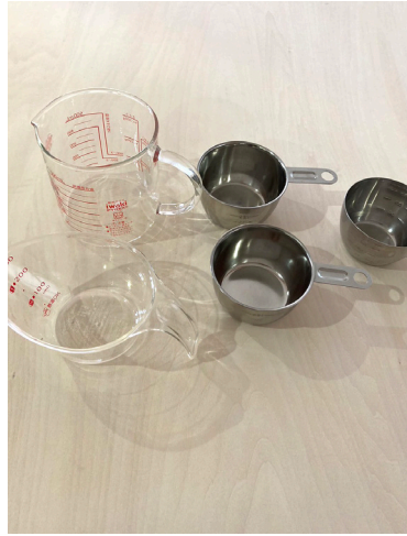
計量カップ (500ml①, 300ml①, 200ml③)